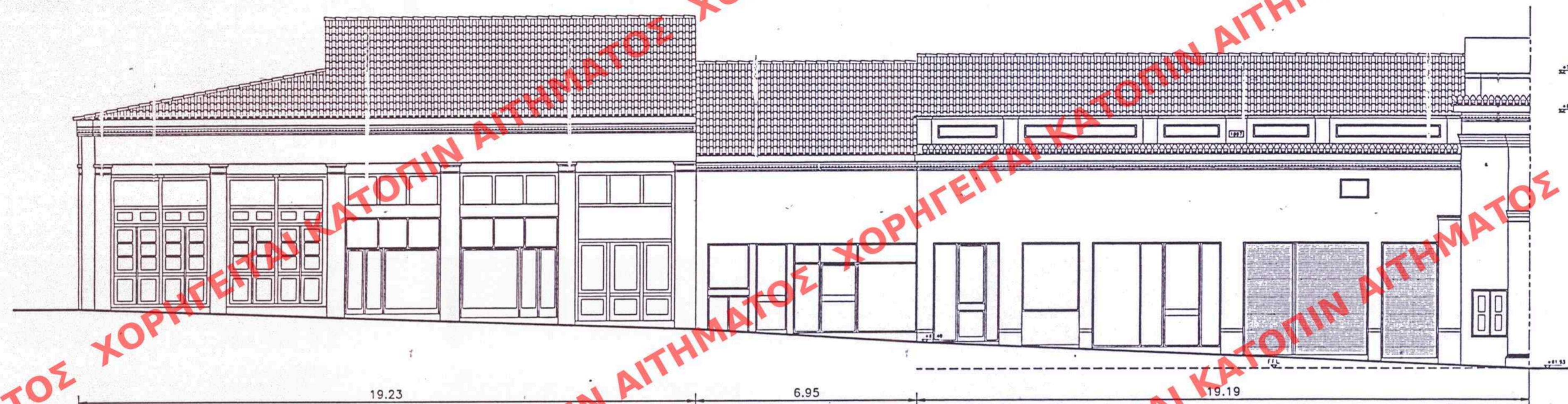
ΥΠΑΡΧΟΥΣΑ ΚΑΤΑΣΤΑΣΗ ΟΨΗ ΟΔΟΥ ΑΡΕΩΣ EXISTING BUILDINGS AREOS STREET ELEVATIONS

ΠΑΡΟΥΣΕΣ ΟΨΕΙΣ ΥΦΙΣΤΑΜΕΝΩΝ ΚΤΙΡΙΩΝ PRESENT FACADES OF EXISTING BUILDINGS